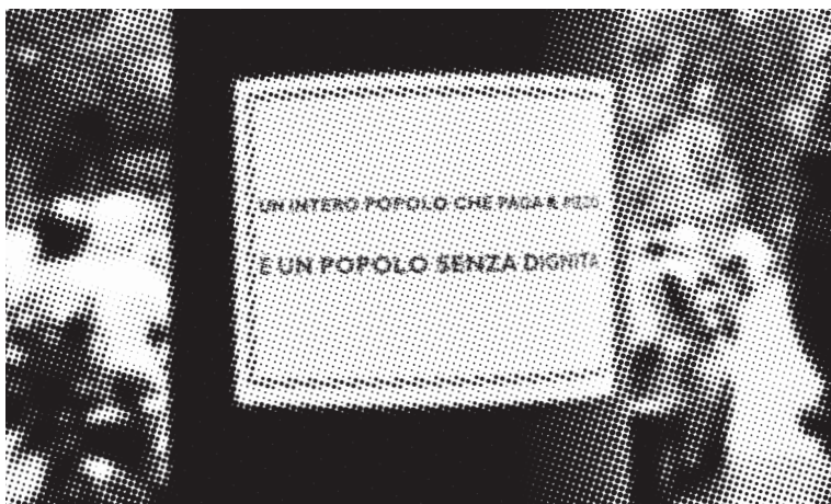
Pegatina que apareció en el centro de la ciudad el 29 de junio.