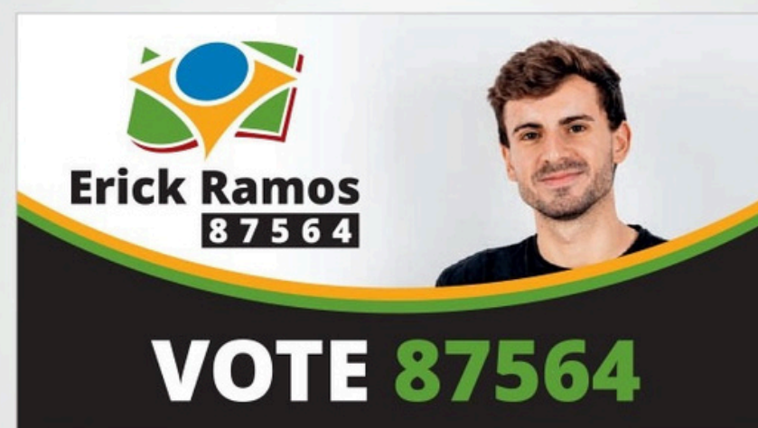
CARTÃO DE VISITA